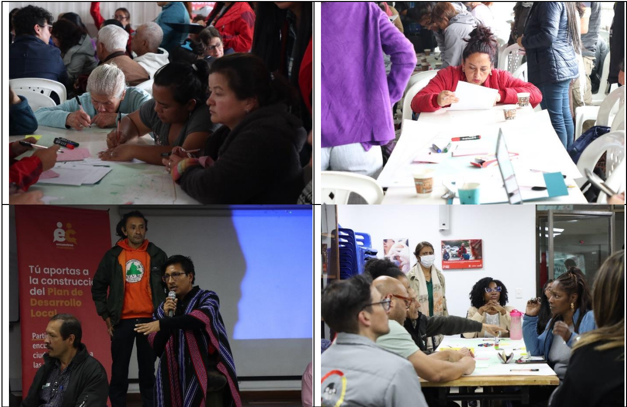
Ilustración 2: